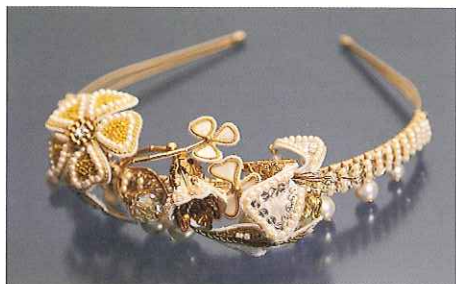
二村恵美「Celebration of Royal Wedding」